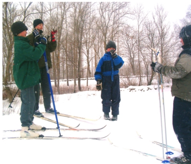
Kelgumäge ning selle kõrval asuvat liuvälja kasutavad lapsed väga aktiivselt.

Matti Mägi sõnul ei piirdu terviserada vaid 1, 8 kilomeetriga, sest tulevikus oleks võimalik teha ka 4- 5