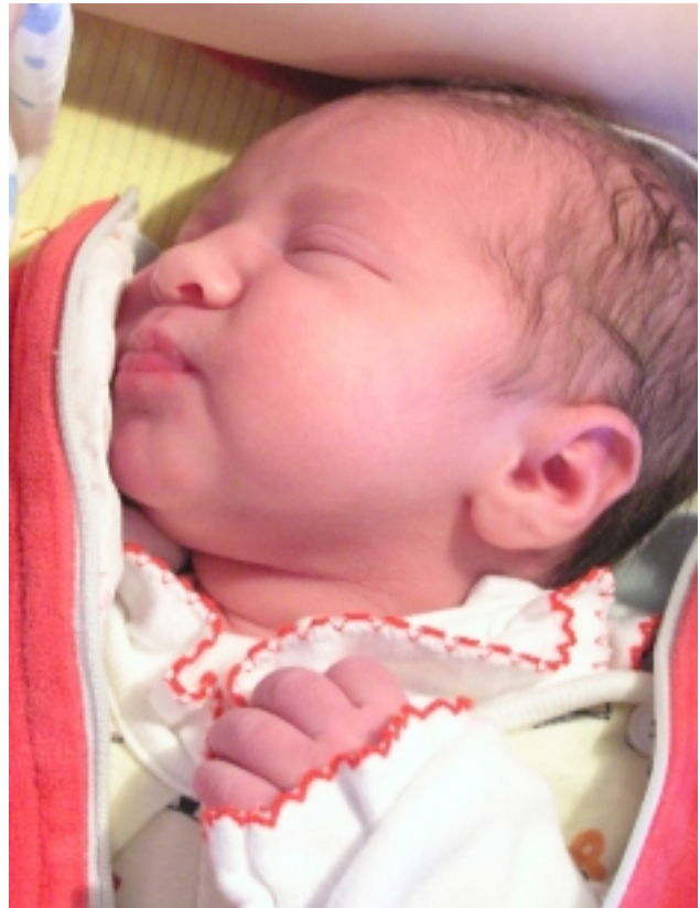
Käesoleval aastal makstakse lapsevanemale sünnitoetust 3000 krooni, kui lapse sünd on registreeritud Pihlta vallas.

Vallalt saab käeoleval aastal taotleda invavahenditootust, kui aastas rent või üür ulatub üle 500 krooni. Selle aluseks on avaldus (ära peavad olema